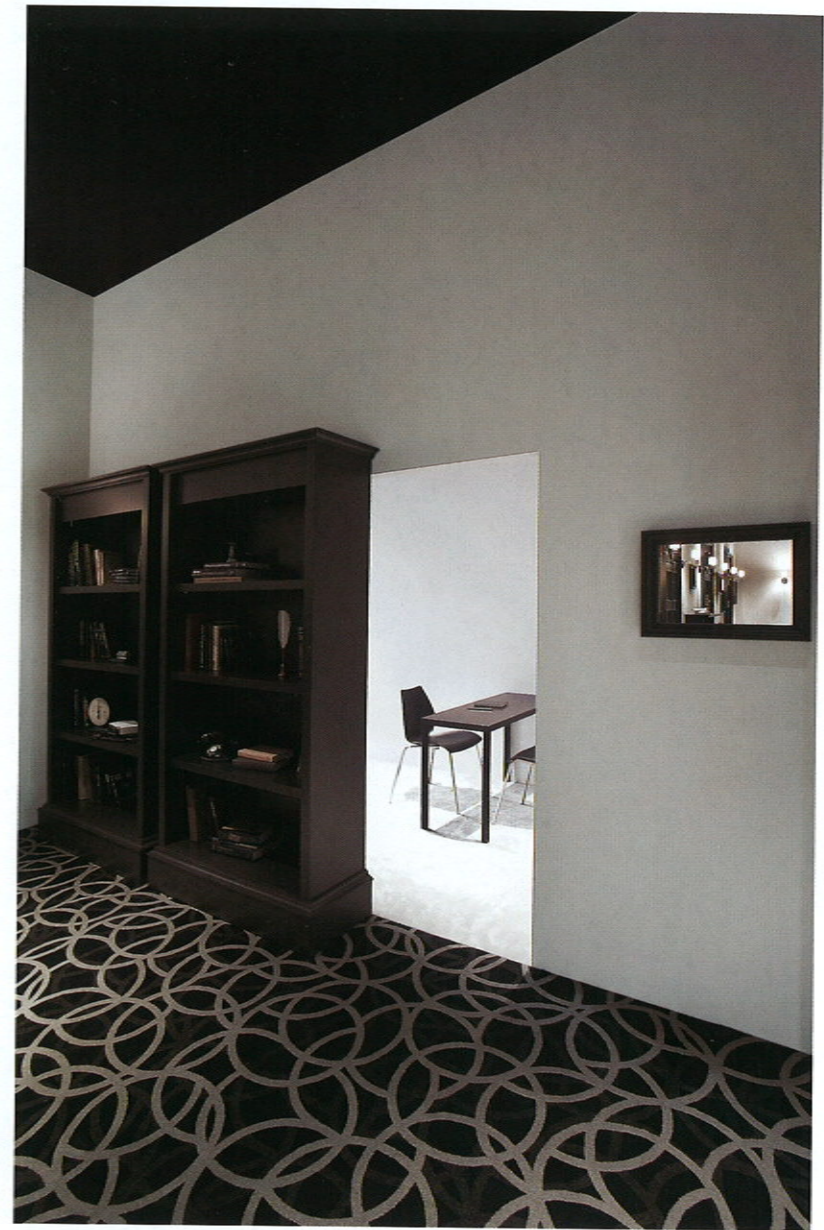
左頁/待合を治療室側から見通す。奥の扉はイミテーションで、開けた先には窓がある 上/ディスプレイ棚をずらした先にある治療室